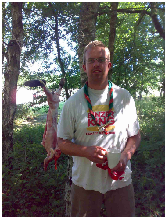
her står slagteren med en af ofrene

og næste uge vil de også gå løs på hønsene.